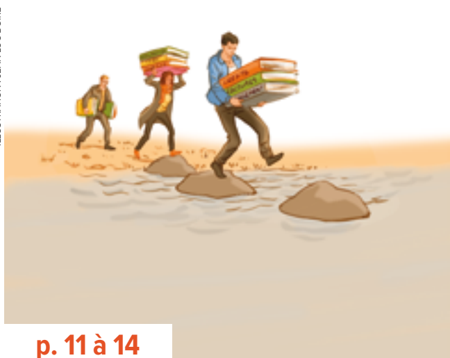
ILLUSTRATION : JEAN-LUC BOIRE