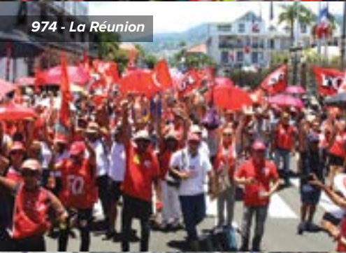
974 - La Réunion