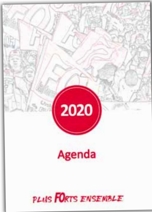
Agenda médium : 8,50 € * format : 165 x 240 mm