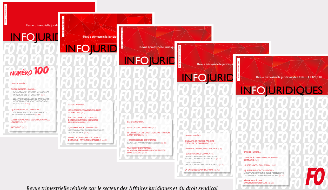
Revue trimestrielle réalisée par le secteur des Affaires juridiques et du droit syndical.

Le secteur des Affaires juridiques et du droit syndical édite une revue trimestrielle de droit qui permet aux militants de se tenir à jour des dernières évolutions, tant de la loi que de la jurisprudence.