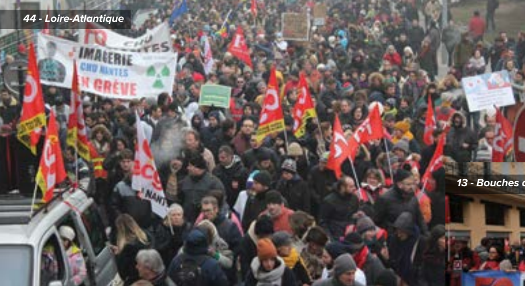
44 - Loire-Atlantique