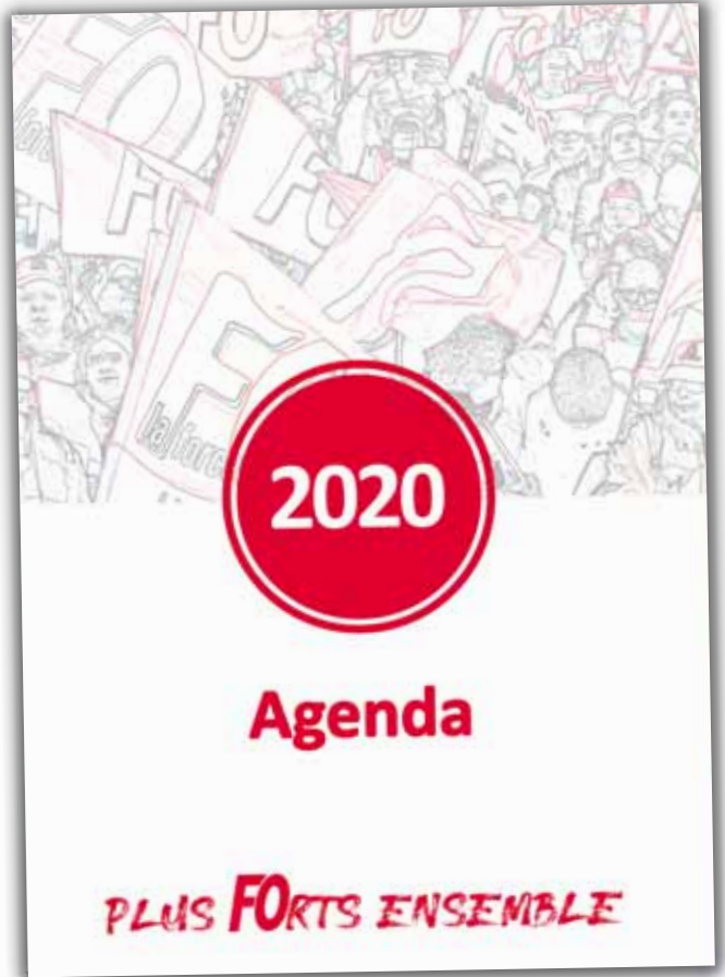
Agenda bureau : 16 € * format : 210 x 297 mm