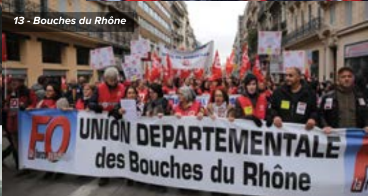
13 - Bouches du Rhône