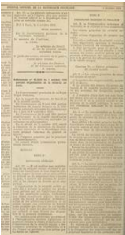
Extrait du Journal officiel du 6 octobre 1945 publiant l'ordonnance du 4 octobre 1945.