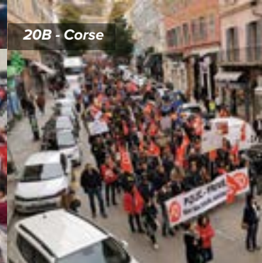
20B - Corse