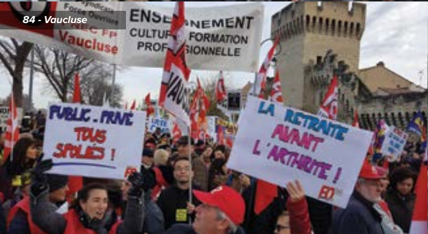
84 - Vaucluse