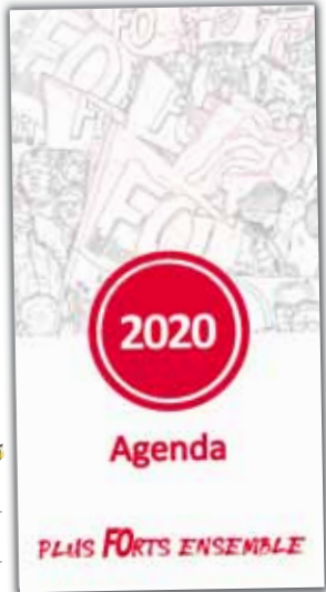
Agenda poche : 1,70 € * format : 90 x 168 mm