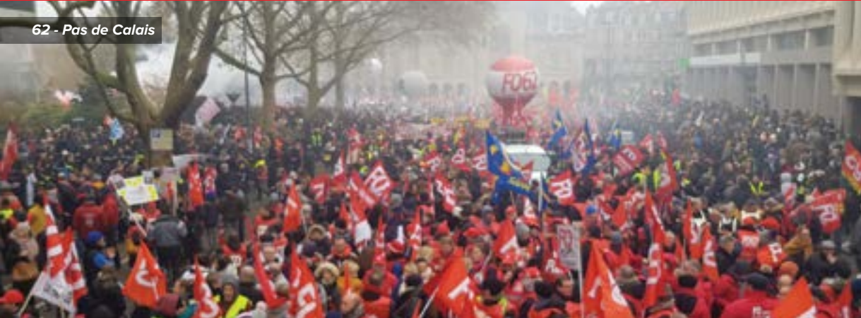
62 - Pas de Calais