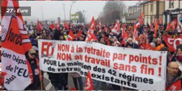
27 - Eure