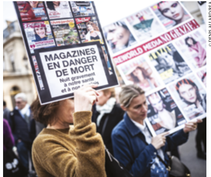
Manifestation d'employés de Mondadori France contre le rachat du groupe par Reworld Media, à Paris, le 18 octobre 2018.

Un accord mettrait les emplois en péril. « En 2014, Reworld Media a repris huit magazines dont Lagardère voulait se débarrasser, dénonce l'intersyndicale. Un an après, 90% des salariés transférés avaient été poussés dehors. » Sur 90 journalistes il n'en reste que 5. Les titres, souvent réduits à des vitrines commerciales sur Internet, sont désormais réalisés par des sous-traitants sans carte de presse, qui produisent des