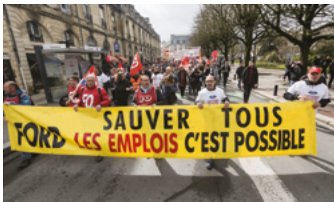
Manifestation de soutien aux employés de l'usine Ford de Blanquefort, le 24 mars 2018.