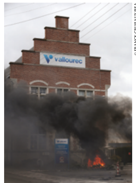
Feu de pneumatiques devant le site Vallourec, à Aulnoye-Aymeries (Nord), le 26 octobre 2018.

Pour FO-Métaux, « en tant qu'actionnaire de référence de Vallourec via BPI France avec 16% du capital, l'État a une responsabilité dans ce dossier et doit se montrer à la hau-