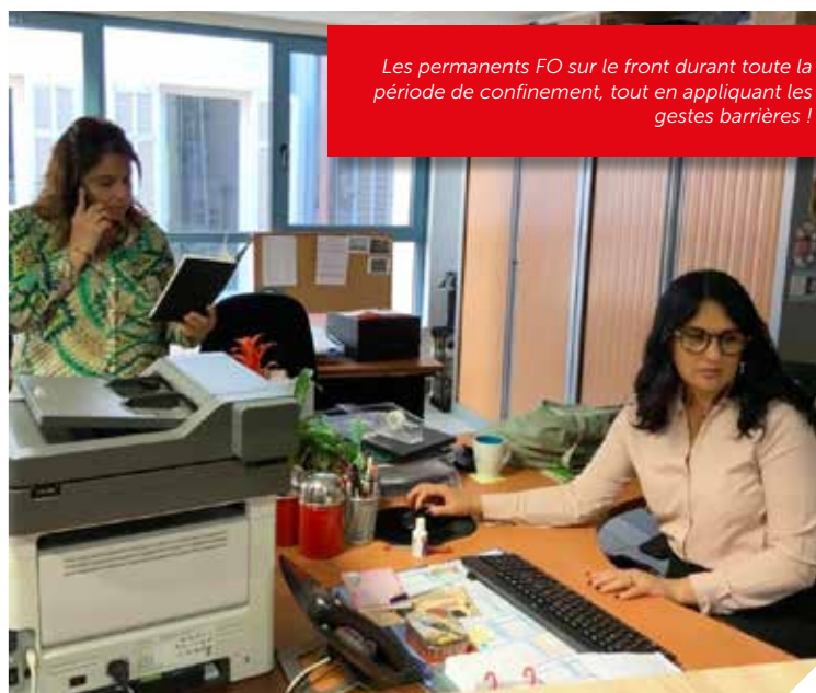
Les permanents FO sur le front durant toute la période de confinement, tout en appliquant les gestes barrières !

Ils sont restés mobilisés, en présentiel, pour répondre aux appels, aux interrogations et aux légitimes inquiétudes des agents. Le syndicat s'est attaché à les informer en temps réel via son Facebook et son blog, et à défendre leurs droits dans une