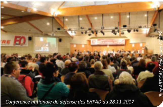
Conférence nationale de défense des EHPAD du 28.11.2017

Depuis des années, la colère gronde au sein des établissements d'hébergement pour personnes âgées dépendantes et c'est elle que les personnels des EHPAD sont venus exprimer le 30 janvier dernier dans un mouvement de grève inédit selon la presse. Le ministère est obligé de l'annoncer dans un communiqué qui fait état de 31,8 %. Ce chiffre étant une moyenne, nombre d'EHPAD ont dépassé le chiffre des 60 à 80% de grévistes. Du jamais vu !